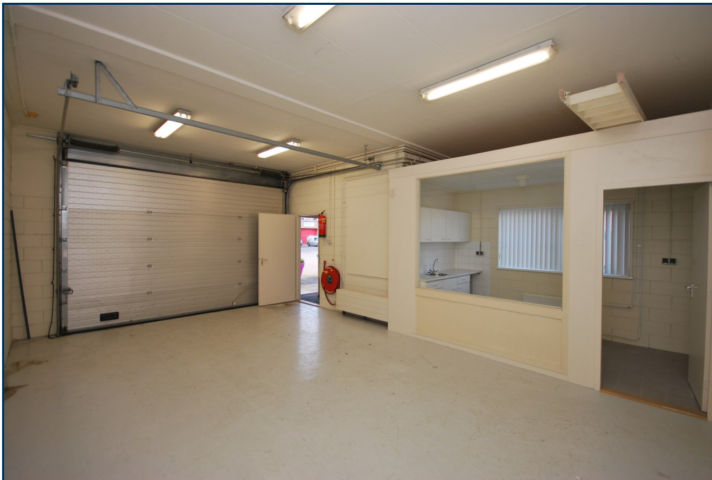
Begane grond 1-