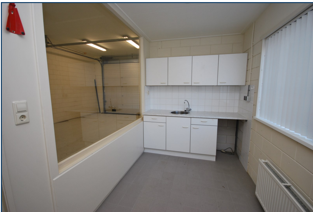
Begane grond keuken