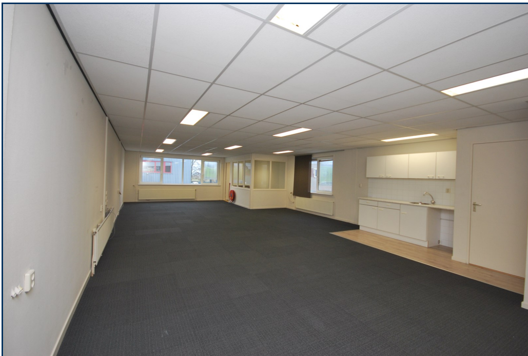
Eerste verdieping 1-