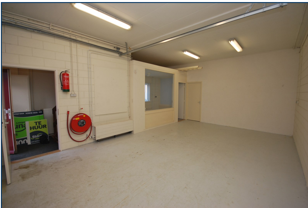
Begane grond 1-