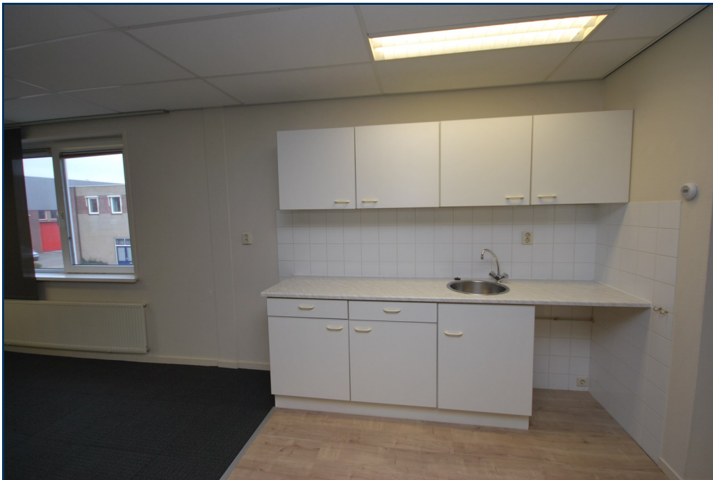
Eerste verdiepnig keuken