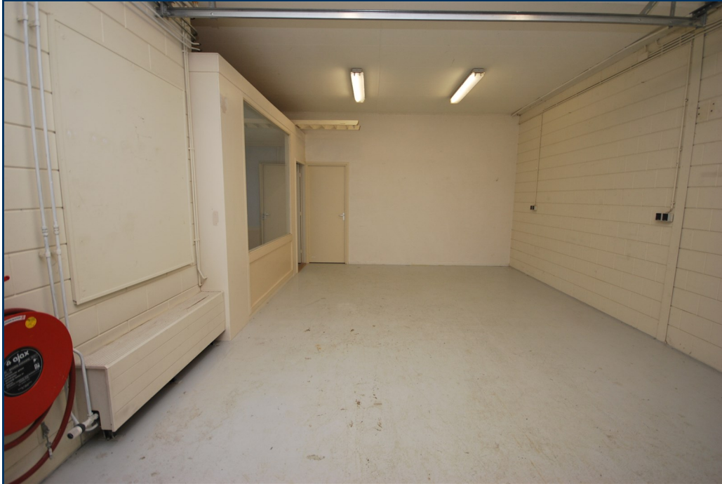
Begane grond 1-