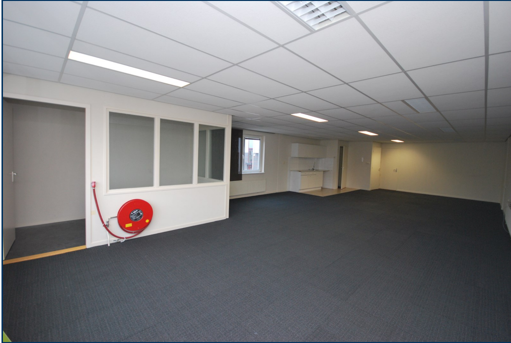
Eerste verdieping 1-